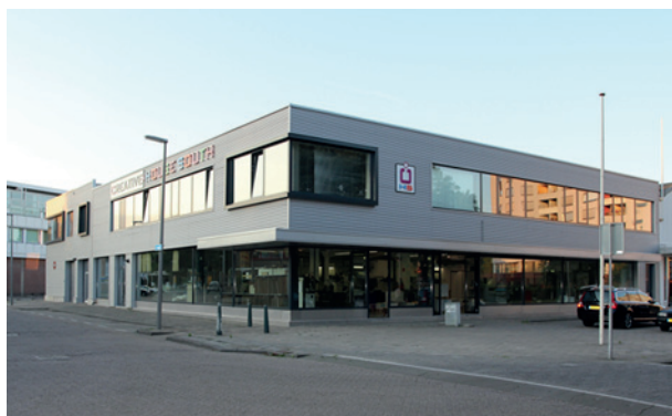
Een afbeelding met een resolutie van 150 DPI